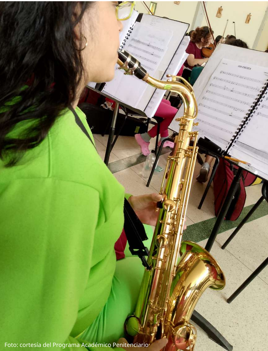
Cuadro N° 1.-Núcleos Penitenciarios a Nivel Nacional (Centros Penitenciarios)