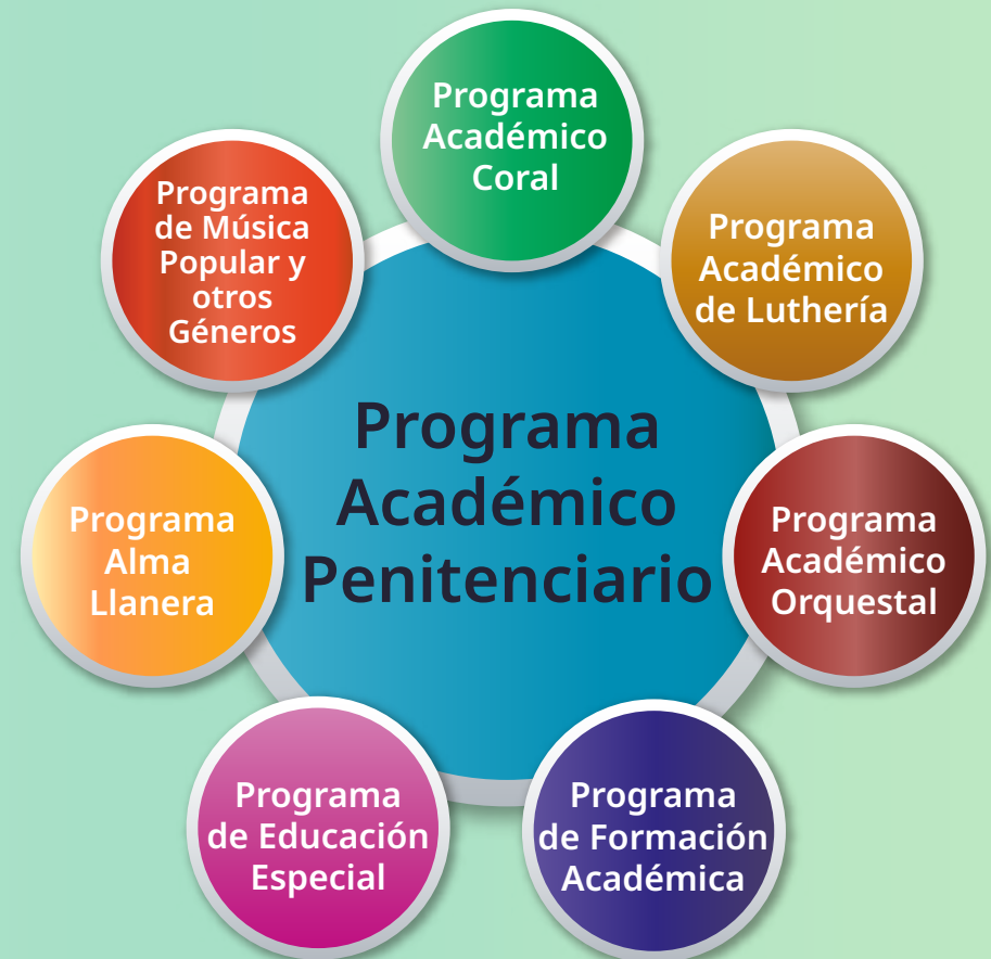
Gráfico N° 1.-Vinculación con otros Programas Académicos de El Sistema