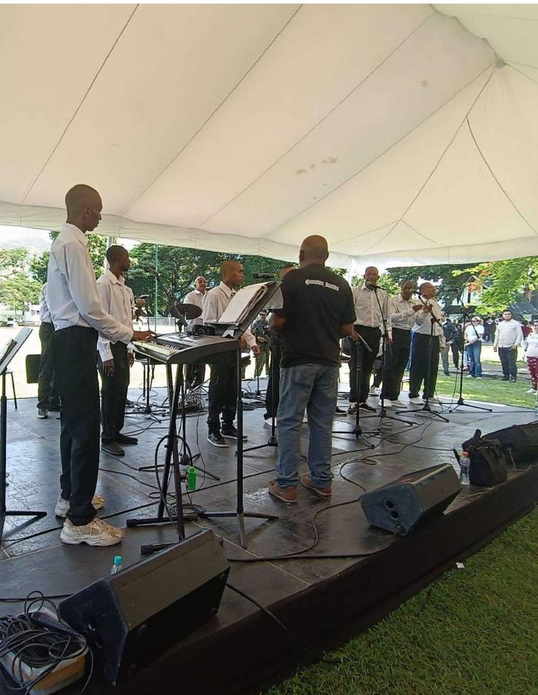
Cuadro N° 7.- Ensamble Pop Latino por Núcleos Penitenciarios