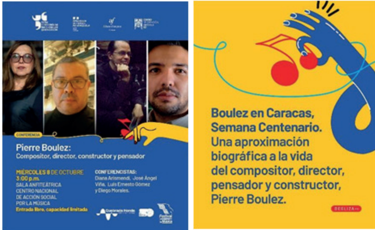
Figura 3. Flyer de ciclo de conferencias «Pierre Boulez: compositor, director, pensador y constructor»

“¿Tú conoces a Antonio Estévez?”, sorprendida y confundida, le contesté inmediatamente: “sí, claro, maestro”. Boulez replicó con firmeza: “Es uno de los hombres más talentosos que conozco”. Mi recuerdo se detiene allí, pero ese encuentro y esa declaración de Boulez, el “semidiós de la música de vanguardia”, sobre Estévez, un compositor de la escuela nacionalista latinoamericana cambió mi vida. Esa noche Boulez me hizo latinoamericanista.