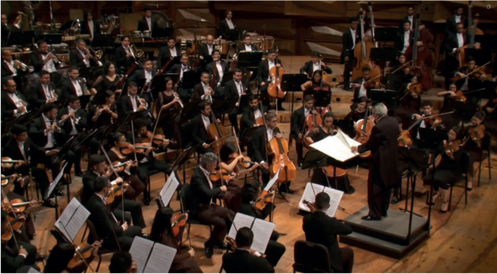
Figura 6. Orquesta Sinfónica Simón Bolívar interpretando Notations I-IV para gran orquesta de Pierre Boulez bajo la dirección de Alfredo Rugeles.