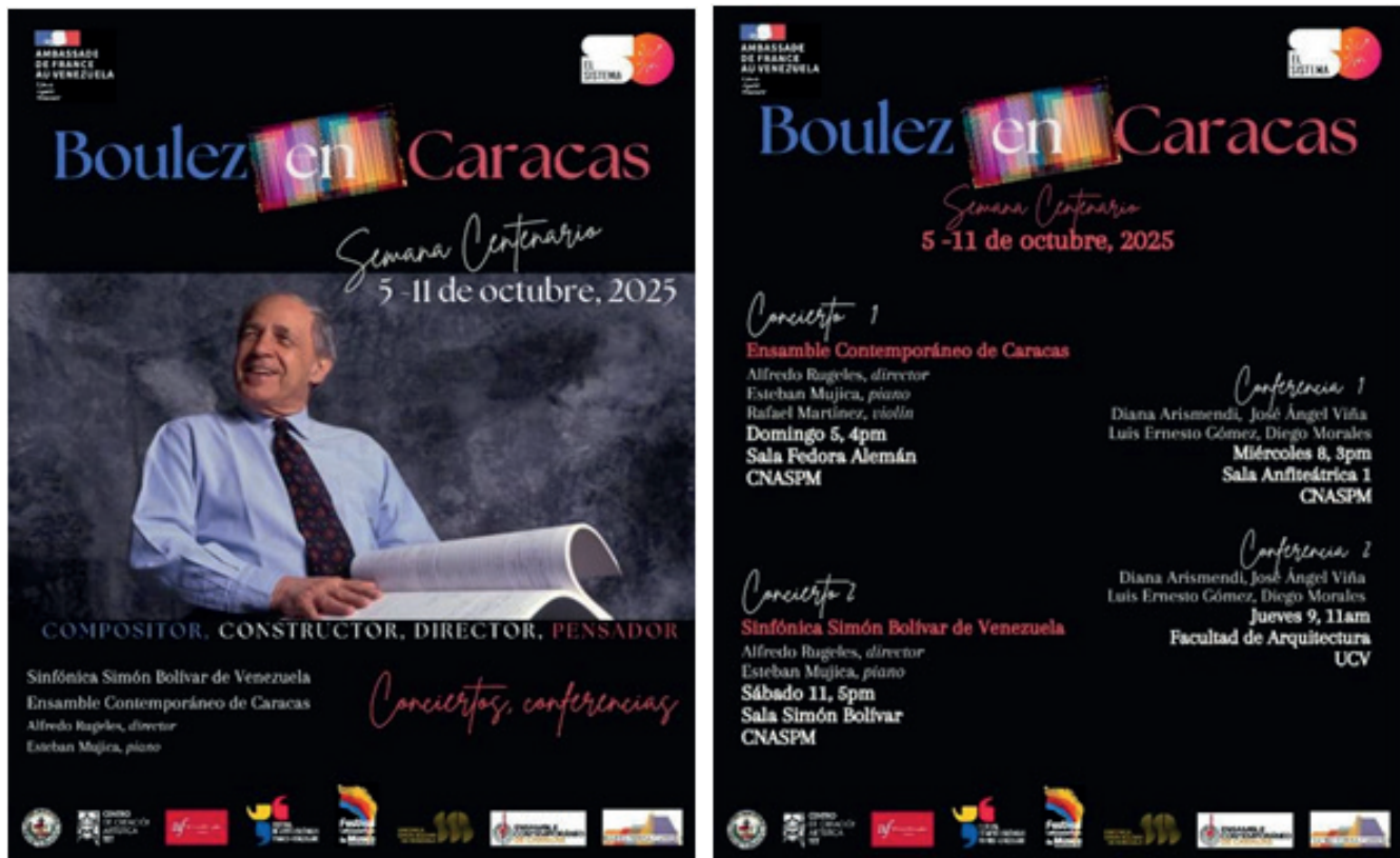
Figura 1. Imágenes del flyer del evento Boulez en Caracas, semana Centenario, entre 5 al 11 de octubre, 2025.

Pierre Boulez (1925–2016) fue una figura central de la música de vanguardia del siglo XX, al destacar como compositor, director de orquesta y pensador. Abanderó el movimiento postserial, luego de la Segunda Guerra Mundial, y fundó instituciones vertebrales para la experimentación y difusión de la nueva música como el Ensemble Intercontemporain y el Institute de Recherche et Coordination Acoustique/Musique (IRCAM).