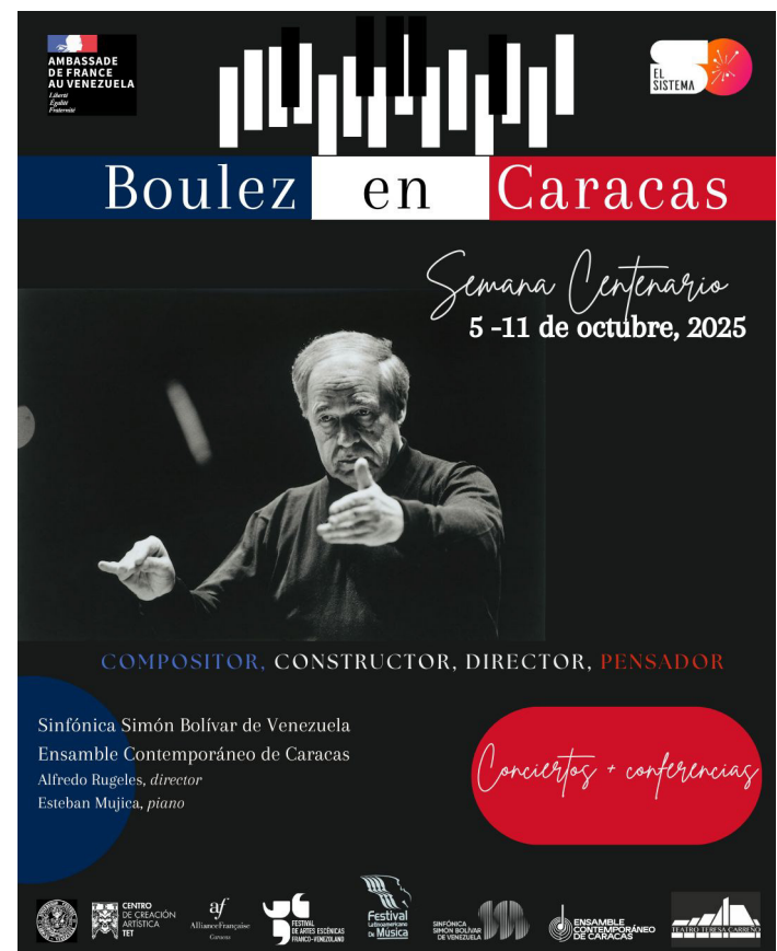
Figura 4. Flyer de programación «Boulez en Caracas»