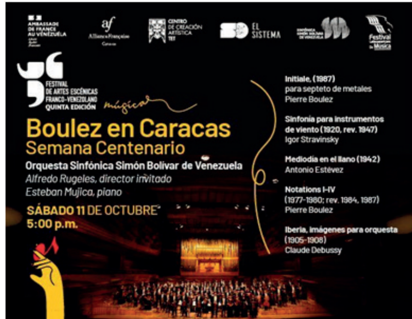
Figura 5. Flyer del Concierto Boulez en Caracas Semana Centenario.

Seguidamente se ejecutó la Sinfonía para