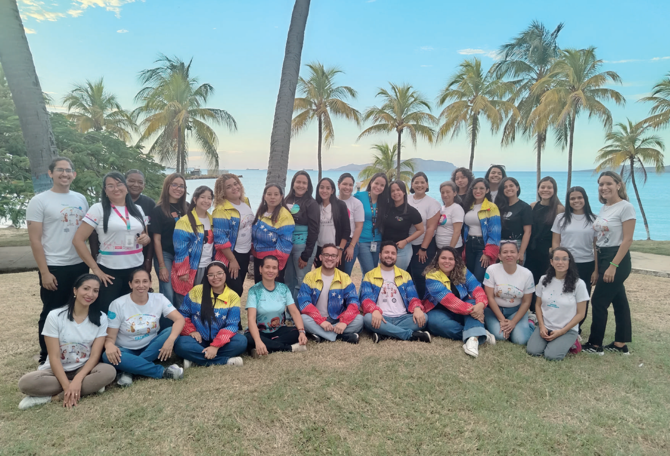
Foto: I Encuentro Nacional de Formadores, PNI Puerto La Cruz (5 al 8 de noviembre 2025). Anzoátegui.