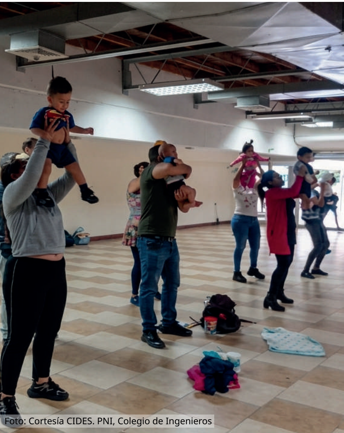
PNI, Colegio de Ingenieros