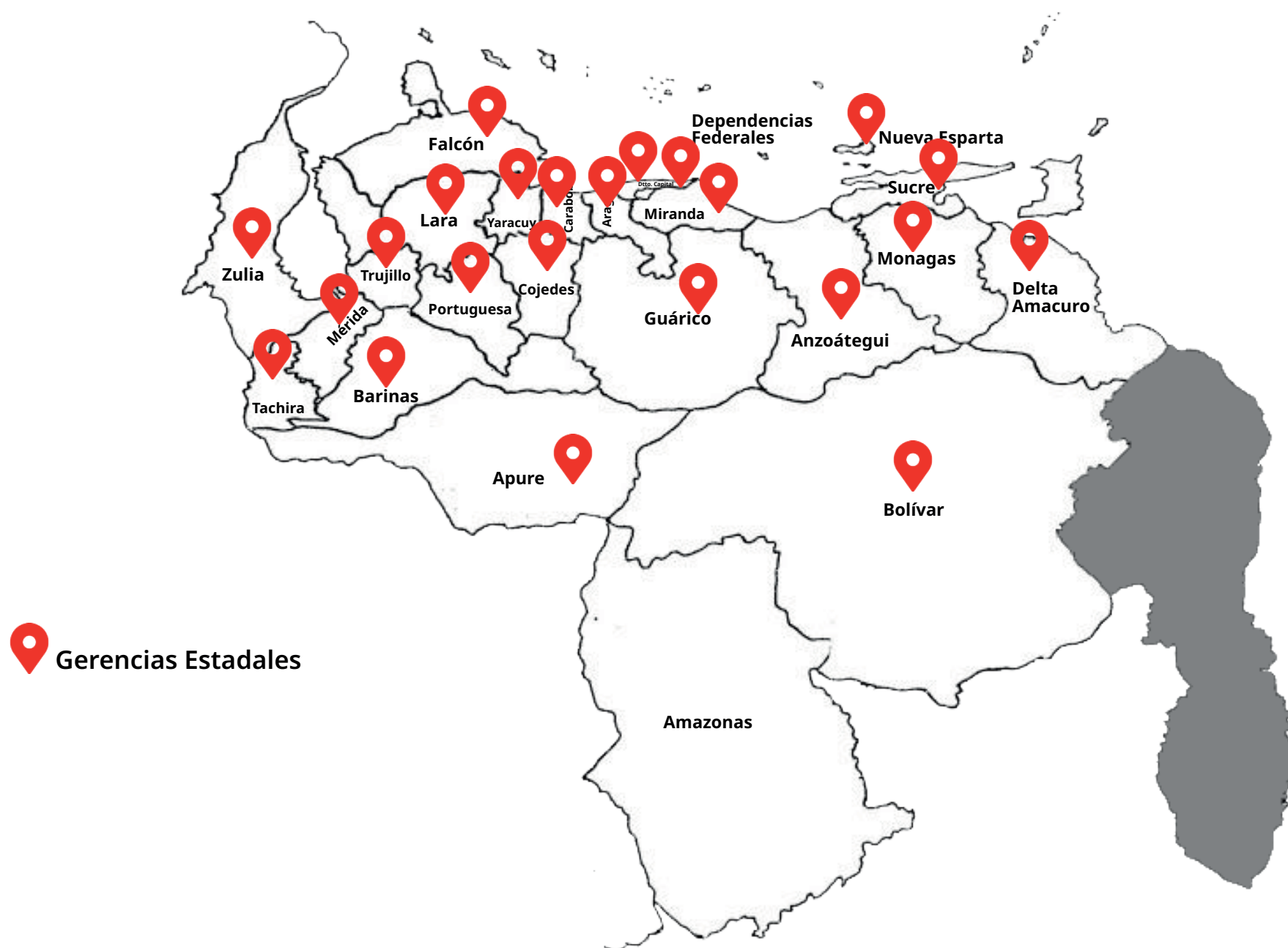
Gráfico N° 1.- Programa Nuevos Integrantes a nivel Nacional